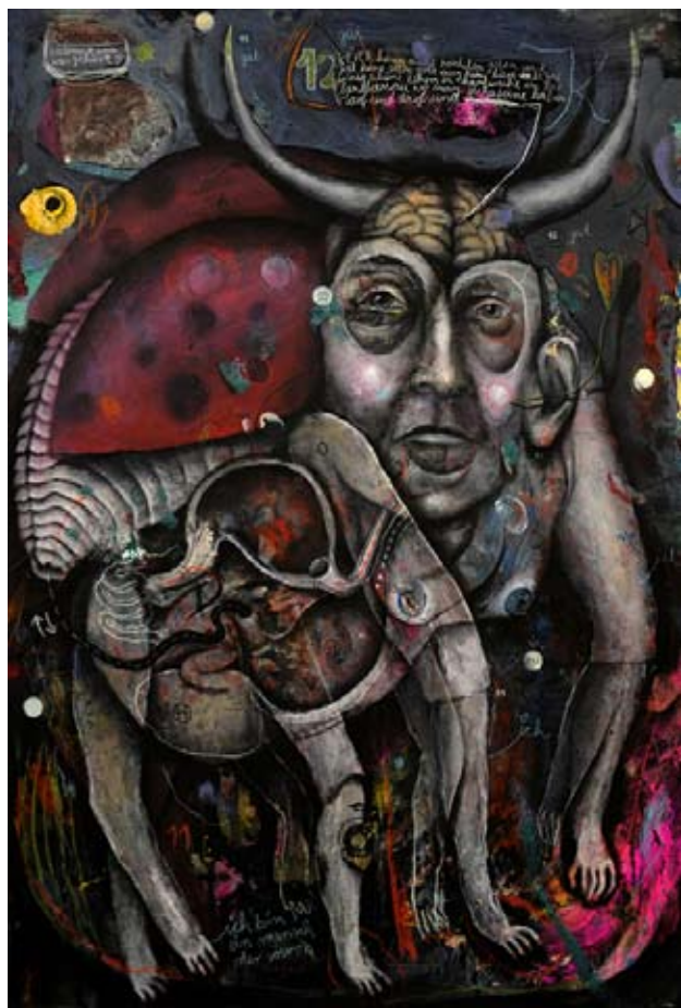
Dominik Schmitt, « glückskefir », 2017, huile et acrylique sur toile, 70x50cm