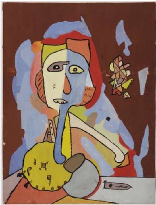
Gaston Chaissac, «Visage aux hachoirs», 1946

Jean-Joseph Sanfourche (1929-2010) un autre artiste français d'art singulier, peint, sculpte et réalise des émaux en utilisant des matériaux insolites (silex et os humains) auxquels il confère des pouvoirs magiques.