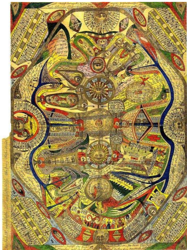
Adolf Wölfli, 1911

Les principaux représentants sont : Adolf Wölfli (1864-1930), Fleury-Joseph Crépin (1875-1948), Augustin Lesage (1876-1954), Aloïse Corbaz (1886-1964), André Robillard (1931)