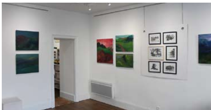
Exposition de Frédéric Jacquin - 18 oct/16 nov 2019

La Maison Bleue se compose de deux salles qui ont, depuis cette saison 2019-2020, chacune leur propre destination.