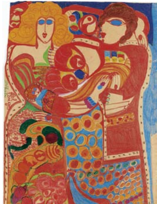
Aloïse Corbaz, «Bal tango, hôtel rosière», cinquième période 1960-1963. Craie grasse et crayon de couleur sur papier.