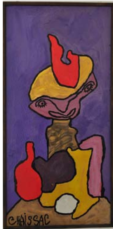
Gaston Chaissac, «La belle dame violette», 1961