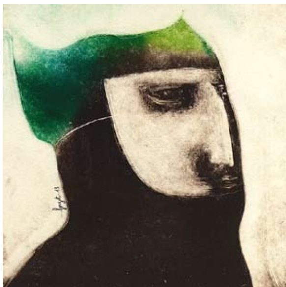
Christophe Forget, monotype

S'initiant ensuite à la technique de la gravure et plus particulièrement au monotype , l'artiste multiplie les interprétations du monde végétal, qui s'impose à lui comme un sujet foisonnant de surprises, de mystères, et lui permet une expérience spontanée et toujours renouvelée du dessin, des formes et des couleurs.