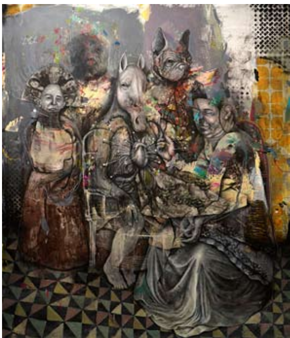
Dominik Schmitt, « schweigeminute », 2016, huile et acrylique sur toile, 180x150cm

« Pour moi, le concept principal de l'art en général est l'honnêteté. Les artistes devraient faire ce qu'ils ressentent. Ils devraient exprimer ce qu'ils sont, pas ce que le public veut voir ou ce qui est vendable sur le marché de l'art. À mon avis, c'est la chose la plus importante en art – c'est ce concept qui m'a conduit à créer ma propre manière de créer. »